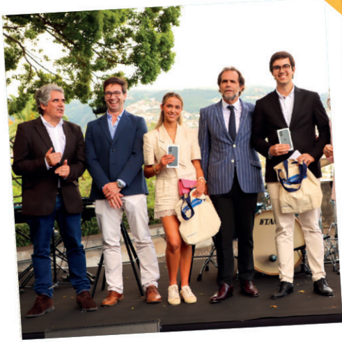
Diário de Notícias da Madeira • Prémio Supercorrespondentes