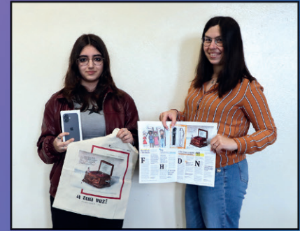
Prémios para o artigos mais criativo de cada edição do 'A Tua Vez!'