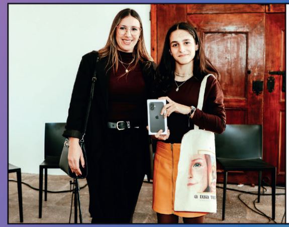
Prémio da capa mais criativa do suplemento