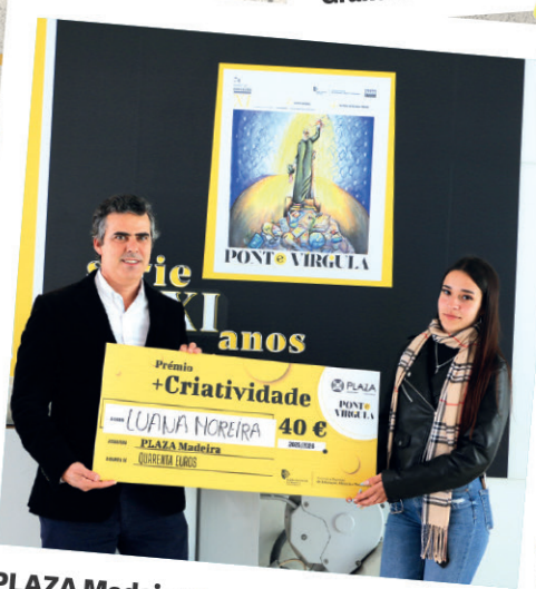
PLAZA Madeira • Prémios '+Criatividade'