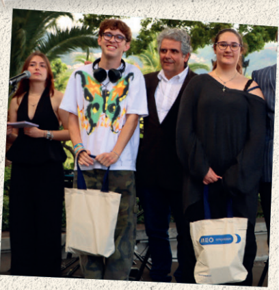
Diário de Notícias da Madeira • Menções honrosas aos participantes do Concurso 'Grande Ideia' com apoio da MEO