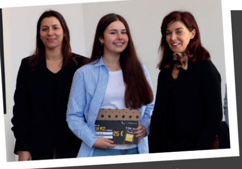
Prémios ao concurso 'A Capa do A TUA VEZ é minha'