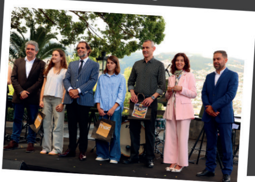
Prémios aos vencedores do concurso 'Na Ponta da Língua'