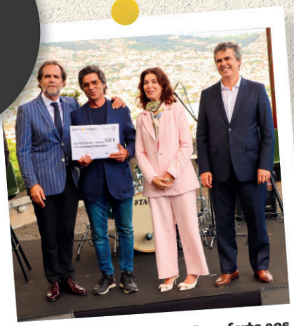
PLAZA Madeira • cartões oferta aos alunos correspondentes, vencedores, participantes e escolas do concurso 'Grande Ideia'