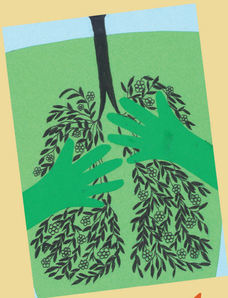
detalhe da ilustração vencedora